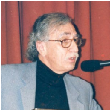
Γράφει ο Δημήτρης Αποστόλου « Ελύμνιος »