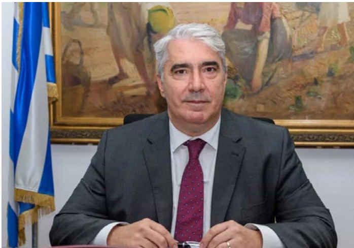
Κεδίκογλου Σίμος Υφυπουργός Ανάπτυξης