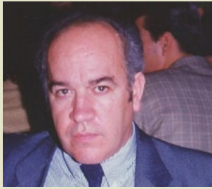
Ο εκδότης - Διευθυντής Αρθρογράφος Γιώργος Πετσάβας