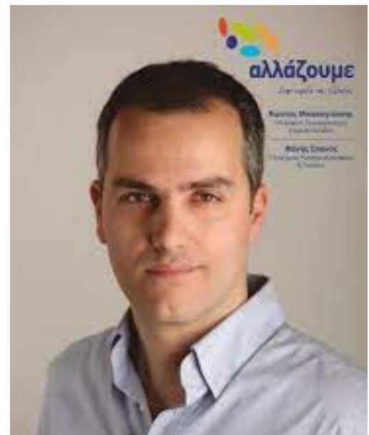
Κελαϊδίτης Γιώργος Αντιπεριφερειάρχης Κλειδώνει με το νέο χρόνο η υποψηφιότητα του στην Νέα Δημοκρατία (περισσότερα στο Πρώτο Άρθρο)