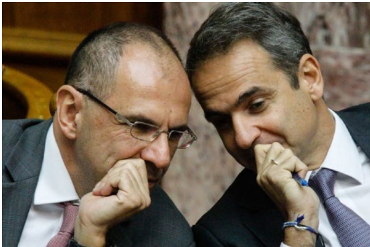
Κ.Μητσοτάκης Πρωθυπουργός Γ. Γεραπετρίτης υπουργός Επικρατείας